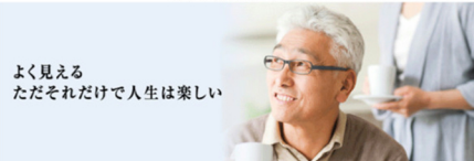
よく見える ただそれだけで人生は楽しい